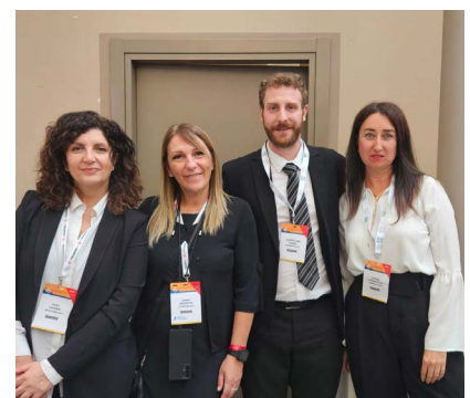
I volti della Segreteria generale SIFO: una certezza per tutti