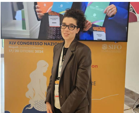
La postazione della redazione SifoWeb