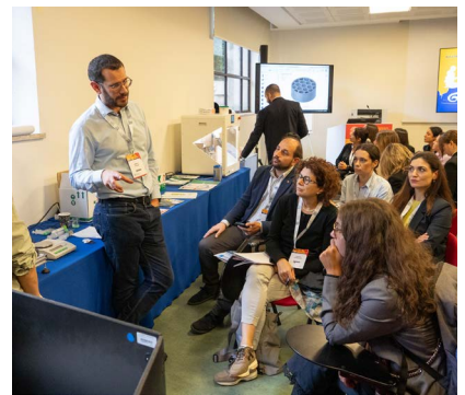
Una delle lezioni proposte all'interno del LabLIFE 2024